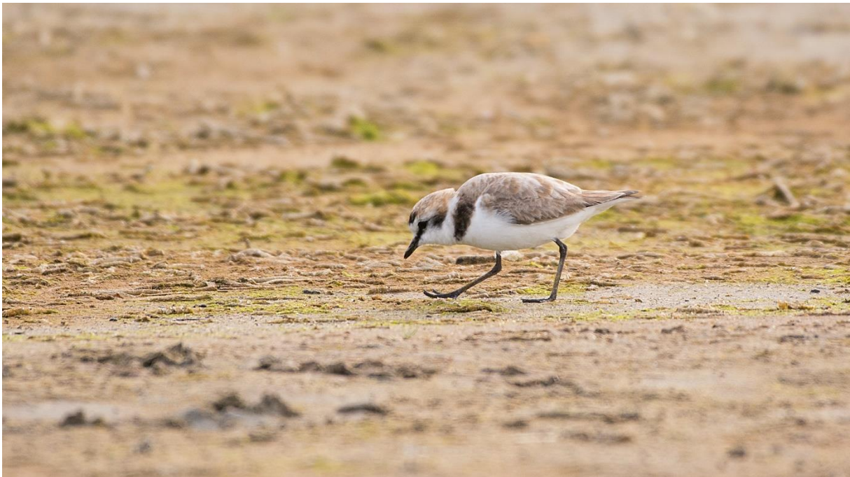
Ad. Seeregenpfeifer-Männchen, Sønderho Strand, 07.06.2019