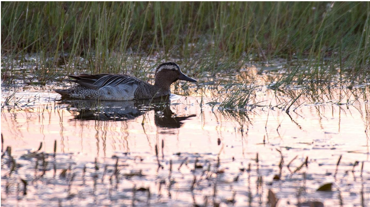
Männliche Knäkente im PK, Sønderho Strandsø, 29.05.2019

Am 29.05. 2 Ind. (1 m, 1 w) auf dem Sønderho Strandsø .