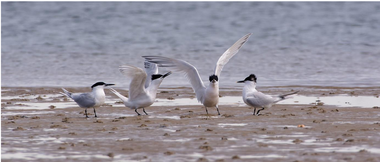
Brandseeschwalben, Søren Jessen Sand, 31.05.2019

Am Sønderho Strand am 25. und 29.05. jeweils 1 die Wasserkante überfliegendes Ind., am 31.05. mindestens 20 Ind. auf dem Søren Jessen Sand .