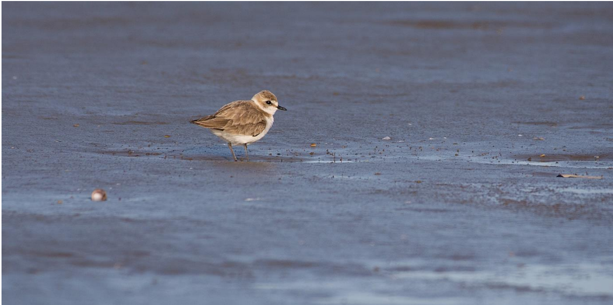
Seeregenpfeifer (Weibchen), Sønderho Strand, 29.05.2019

Eine Charakterart der Insel. Am Galgerev im Süden der Insel am 29.05. ein Paar im Watt. 1 weiteres Ind. am Abend am Sønderho Strand . Am 31.05. insgesamt drei Paare (zwei in den Primärdünen nördlich Nordby , ein weiteres auf dem Søren Jessen Sand ), davon eins bereits mit zwei wenige Tage alten pulli (den ersten auf Fanø festgestellten in 2019). Am 01.06. ein Männchen am Südstrand . 2 Ind. am 07.06. am Sønderho Strand .