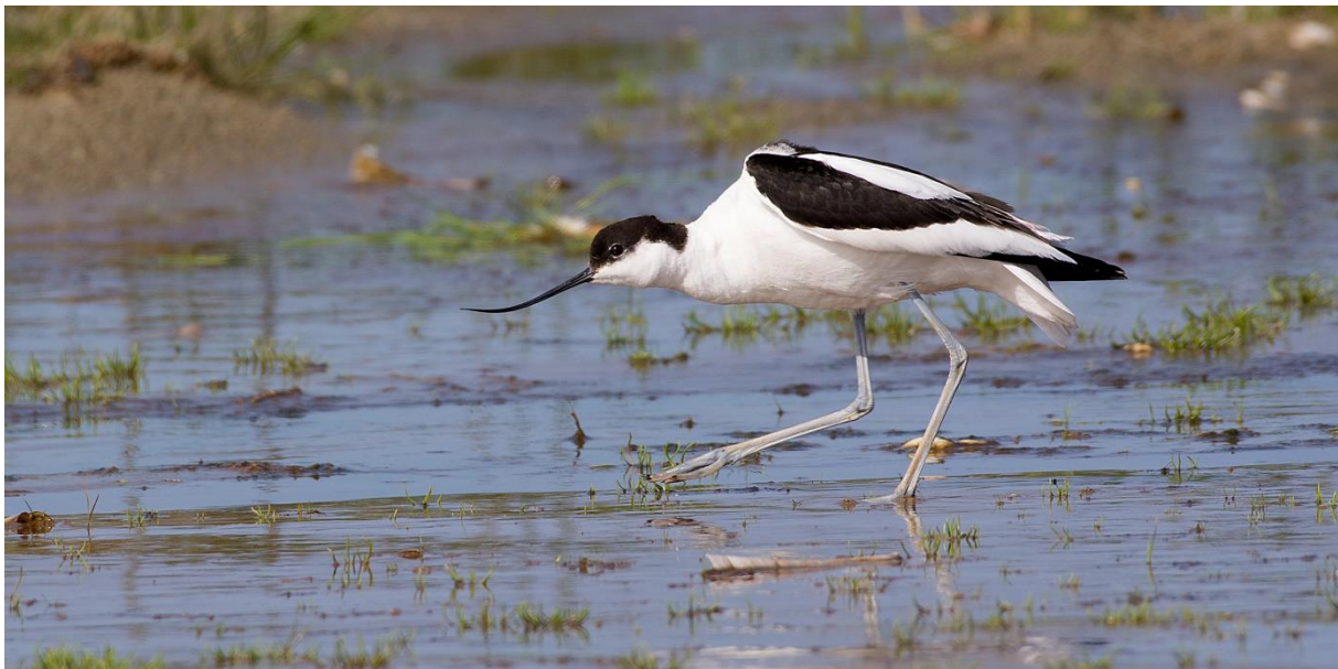
Säbelschnäbler, Sønderho Strand, 27.05.2019

Alle Sichtungen am Sønderho Strand . Jeweils 10 Ind. am 26. und 29.05., ein brütender Vogel direkt am Sønderho Strand gab nach wenigen Tagen sein Gelege auf (siehe Austernfischer).