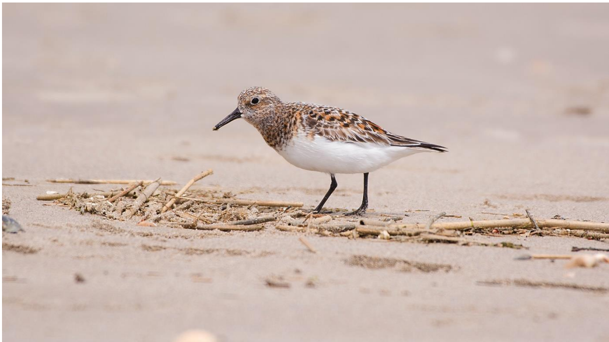
Sanderling, Strand bei Fanø Bad , 28.05.2019

Auf dem späten Heimzug der Art dauerhaft an der gesamten Westküste anzutreffen. Fast durchgängig mit dreistelligen Rastzahlen am Sønderho Strand . Maximum dann auf dem Søren Jessen Sand mit über 1.000 Ind. (31.05.).