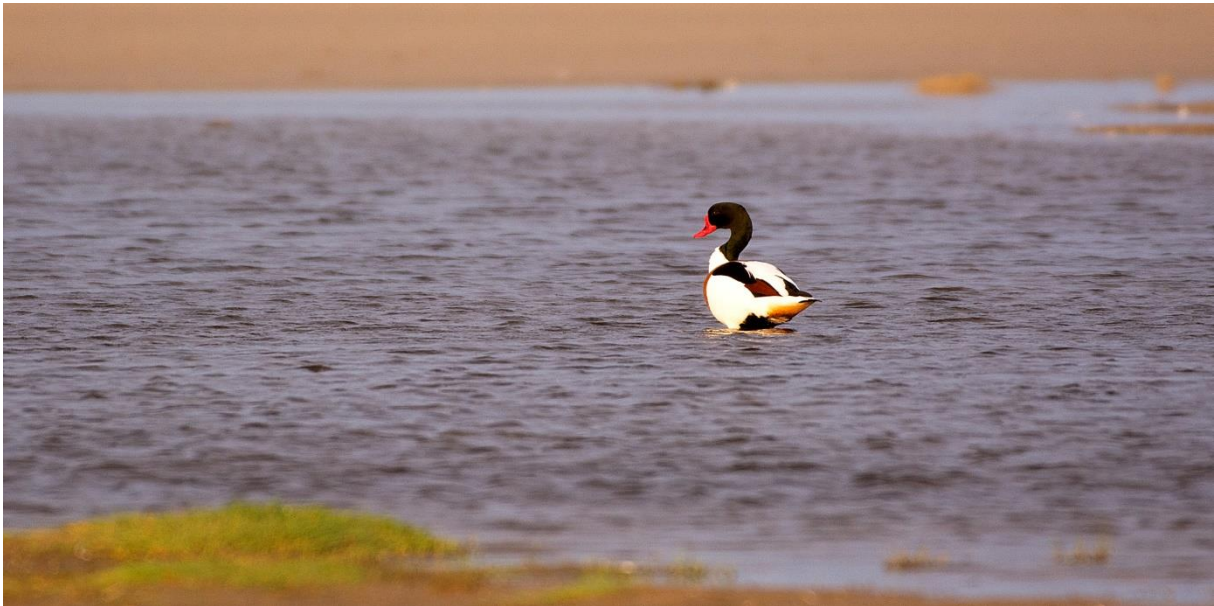
Brandgans im Morgenlicht, Fanø Bad, 05.06.2019

Fast täglich beobachtet. Vor allem im südwestlichen Bereich der Insel (im Umfeld des Strandsø und im Watt) mit meist 4 bis 5 Ind. verlässlich anzutreffen.