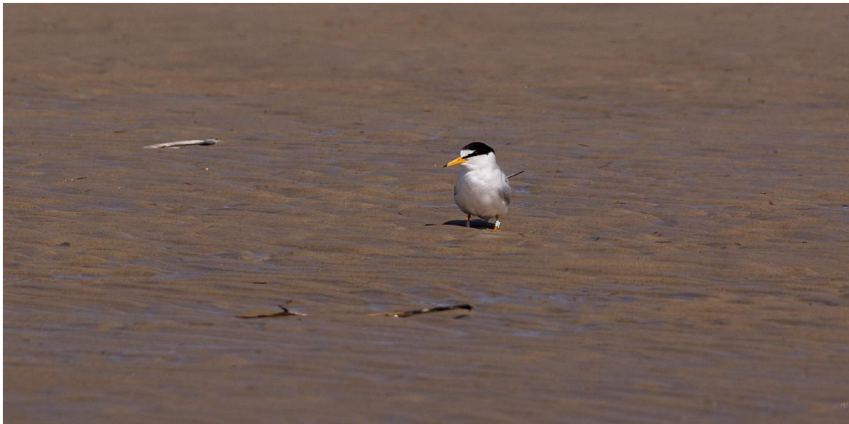
Ad. Zwergseeschwalbe (beringt), Søren Jessen Sand, 31.05.2019

Am 29.05. mindestens 5 Ind. am Sønderho Strand . Auf dem Søren Jessen Sand am 31.05. mindestens 4 Paare. Schließlich 2 Ind. am 06.06. am Sønderho Strand .