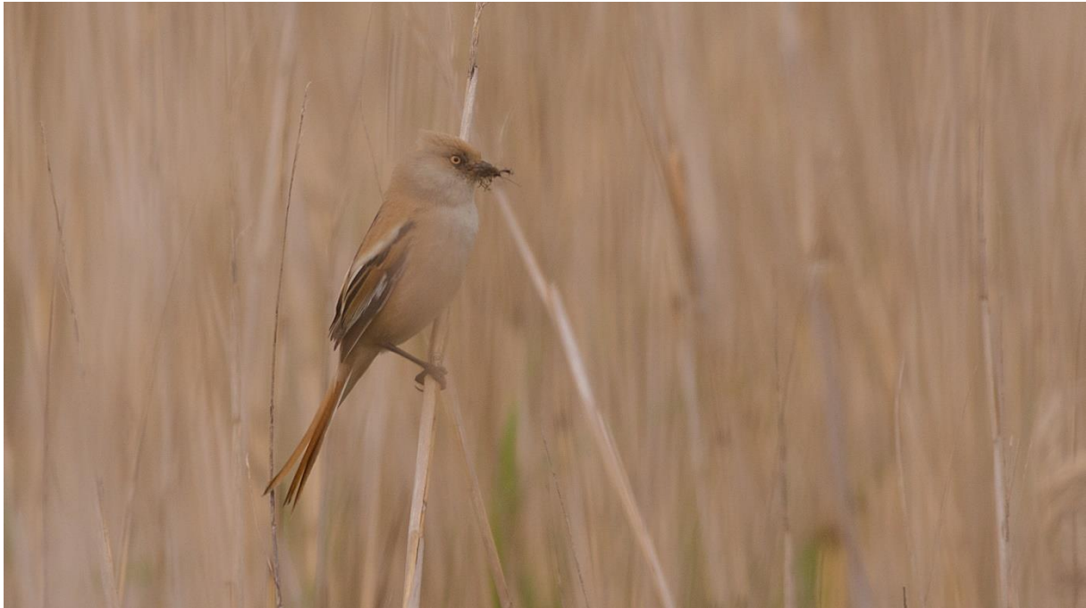
Bartmeise (Weibchen), Pælebjerg , 01.06.2019

Am 29.05. mindestens 5 Ind. am Sønderho Strandsø überfliegend. Dort am 05.06. 1 m im morgendlichen Schilf. Am Pælebjerg am 01. und 03.06. jeweils mindestens 1 Ind. im breiten Schilfgürtel am Übergang zum Strand.