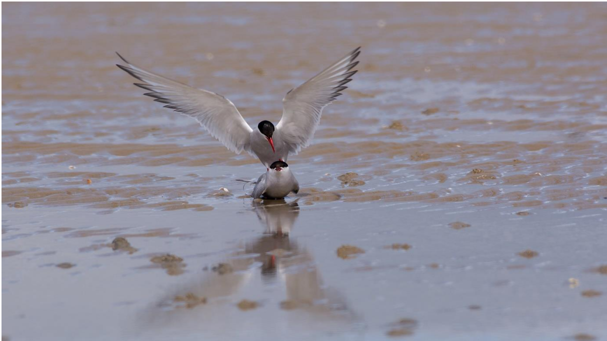
Kopula zweier Küstenseeschwalben, Søren Jessen Sand, 31.05.2019

Am 29.05. 2 Ind. rastend am Sønderho Strand . Mindestens 30 Ind. am 31.05. auf dem Søren Jessen Sand , darunter mehrere Paare (Beobachtung einer Kopula).