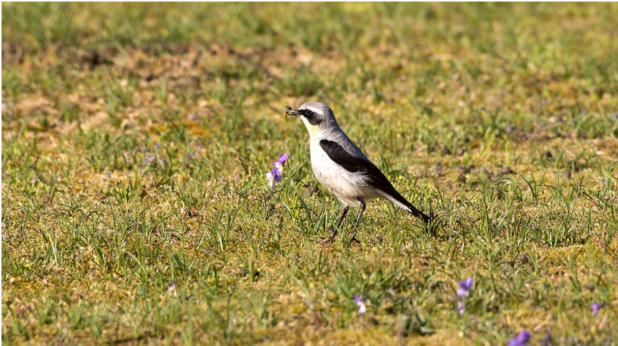
Steinschmätzer (Männchen), Sønderho , 27.05.2019

Steinschmätzer Oenanthe oenanthe Northern Wheatear Stenpikker In der gesamten Ferienhaussiedlung verbreitet, dort am 25.05. mindestens 10 verschiedene Ind., die meisten Beobachtungen in Sønderho und näherer Umgebung.