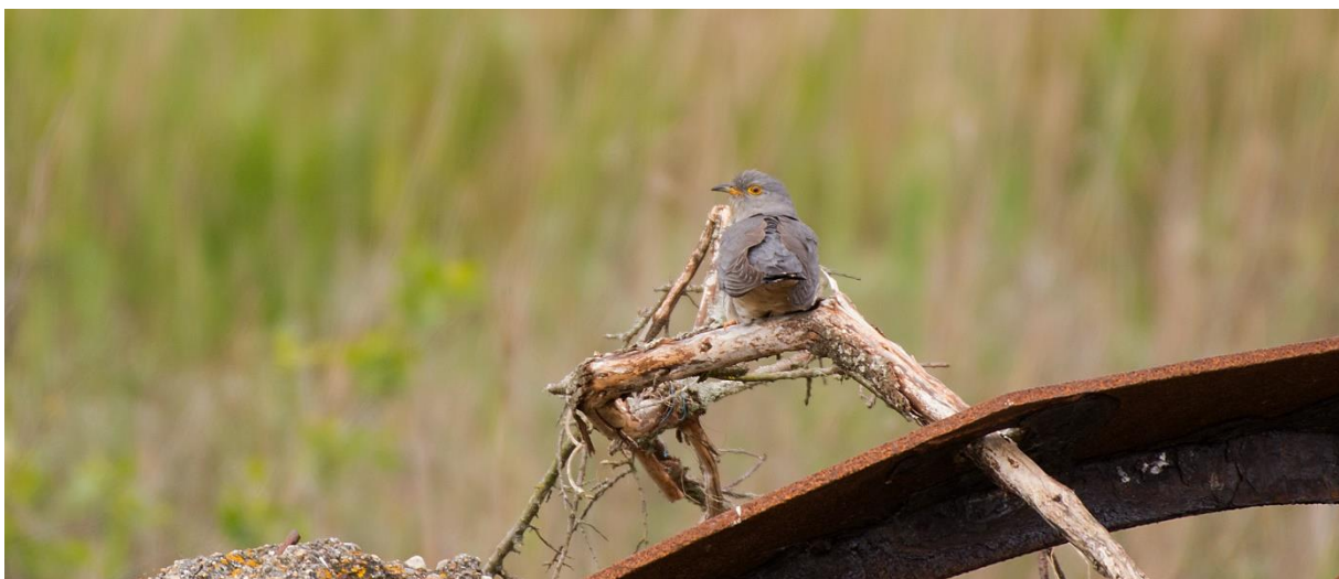
Kuckuck der grauen Morphe, Schilfgürtel am Südstrand, 01.06.2019

Sehr häufig. Täglich zu hören und oft überfliegend zu sehen. In den Dünen um Sønderho und am Strandsø besonders verbreitet. Ausschließliche Sichtungen von Vögeln der grauen Morphe.