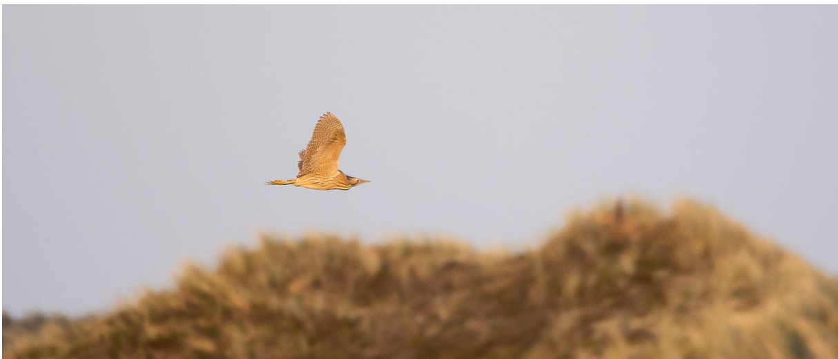
Ins Schilf einfliegende Rohrdommel, Sønderho Strandsø , 02.06.2019

Im kilometerlangen Schilfgürtel im westlichen Teil der Insel stabile Population mit mehreren Brutpaaren. Mehrmals rufend am Pælebjerg und am Sønderho Strandsø festgestellt, dort am Abend des 02.06. 1 Ind. ins Schilf einfliegend, dort mit mindestens 3 Exemplaren auch die meisten Rufer.