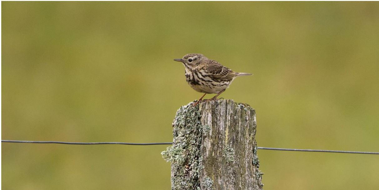
Wiesenpieper, Pælebjerg, 30.05.2019

Eine Charakterart der Dünen- und Weidengebiete, auch am Strand häufig singfliegend zu sehen. Am 25.05. etwa 10 singfliegende Ind. auf etwa zwei Kilometern Strecke am Sønderho Strand .