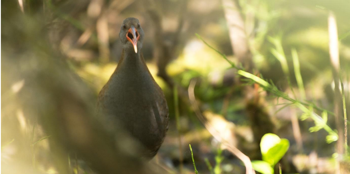
Rufende Wasserralle, Sønderho Strandsø , 28.05.2019

Am Sønderho Strandsø sechs Feststellungen, davon jeweils mindestens 2 Rufer am 26., 29.05. und 05.06. im Bereich um die Beobachtungshütte.