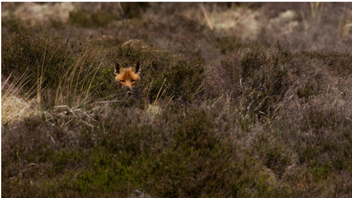
Vertrauter Anblick: auf Fanø leben schätzungsweise 400 bis 500 Rotfüchse (27.05.2019).

Eine von Nord nach Süd verlaufende Hauptverkehrsstraße sorgt auf Fanø dafür, dass alle Orte und Gebiete in vergleichsweise kurzer Fahrtzeit erreicht werden können. Mit Nordby und den südwestlich anschließenden Ortschaften Fanø Bad, Rindby und Rindby Strand konzentriert sich der Siedlungsbereich Fanøs auf die nördliche Hälfte der Insel. Mit Sønderhø liegt lediglich ein Ort im Süden, doch wurde dieses pittoreske Dorf in der Vergangenheit bereits als schönstes Dorf Dänemarks ausgezeichnet. In der westlich an das eigentliche Dorf anschließenden Siedlung befand sich auch das für den Urlaub bezogene Ferienhaus, etwa zehn Gehminuten vom nächsten Strandübergang entfernt.