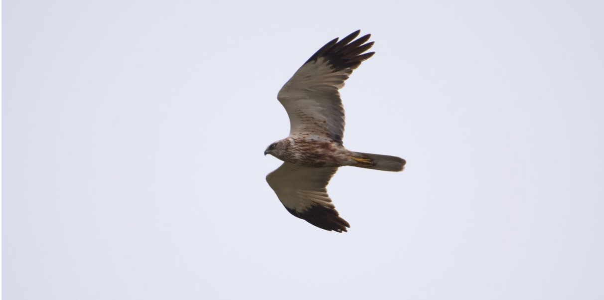
Überfliegendes Rohrweihen-Männchen, Südstrand, 30.05.2019

Die häufigste Greifvogelart auf der Insel. In den Dünen- und Heidegebieten, entlang des Schilfgürtels und unmittelbar am Strandsø in hoher Dichte vertreten. Am 01.06. mindestens 3 Ind. (2 m, 1 w) gaukelnd über Schilf südlich des Strandsø .