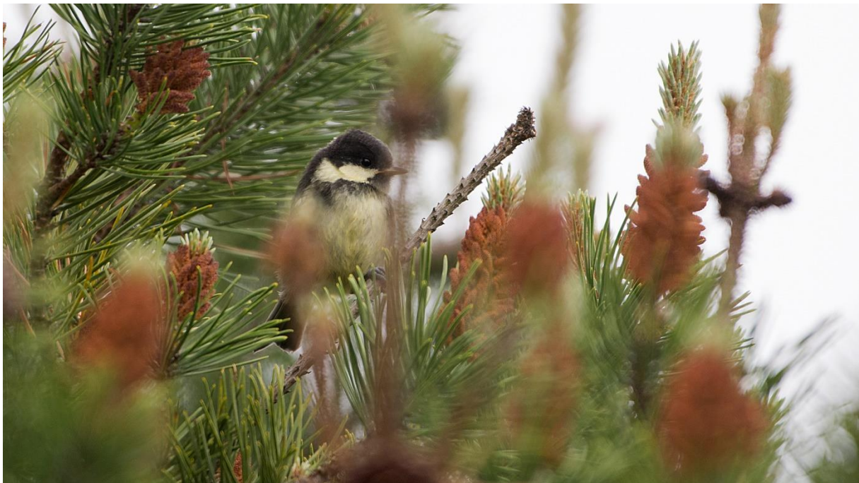
Tannenmeise (diesj.), Klitplantage, 04.06.2019

Klitplantage: 2 bis 3 sing. Ind. am 30.05., einige am 04.06. an fast gleicher Stelle.