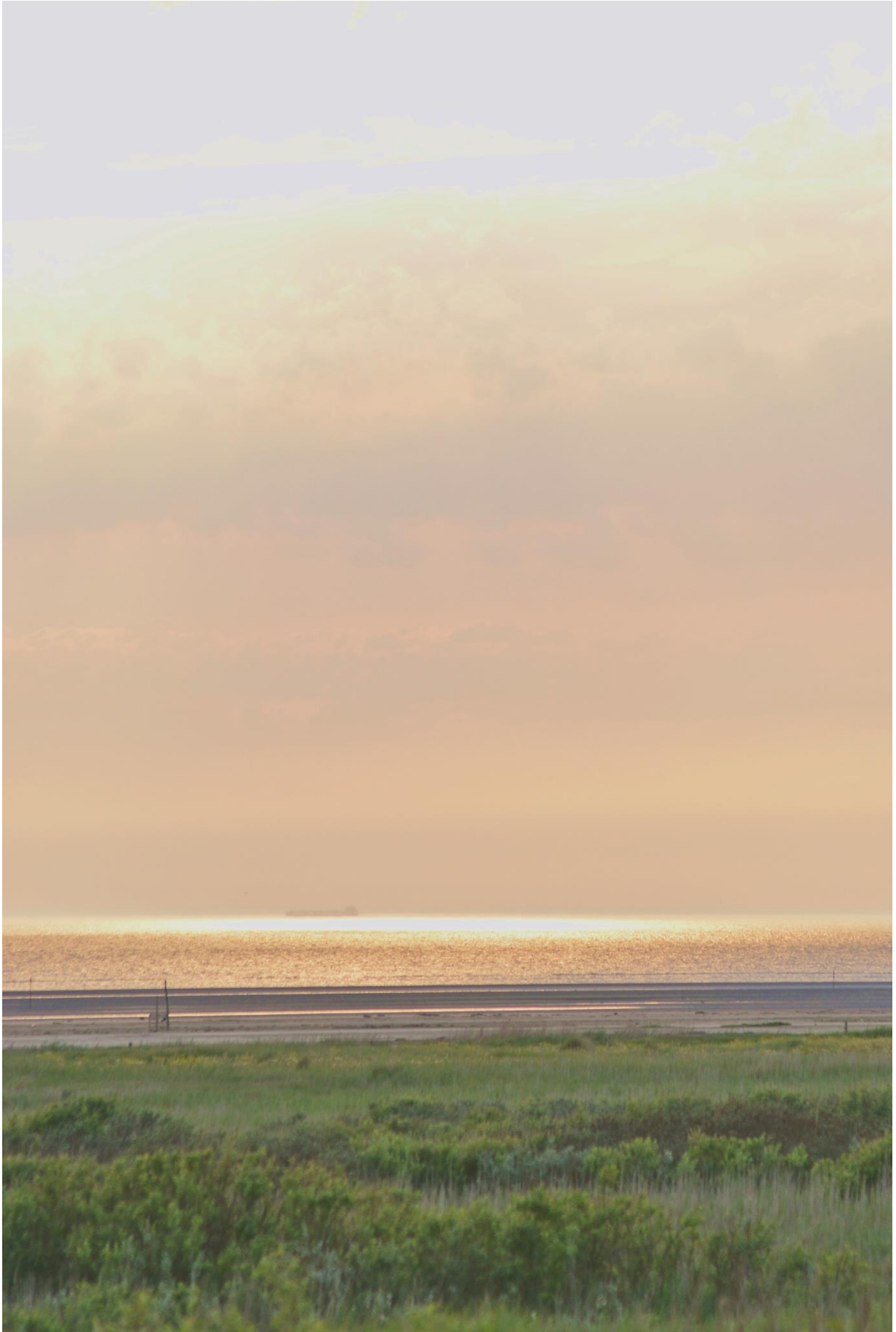
Weite Wege bis zum Wasser: Besonders an den südlichen Strandabschnitten Fanøs ist die Brandung sehr flach.