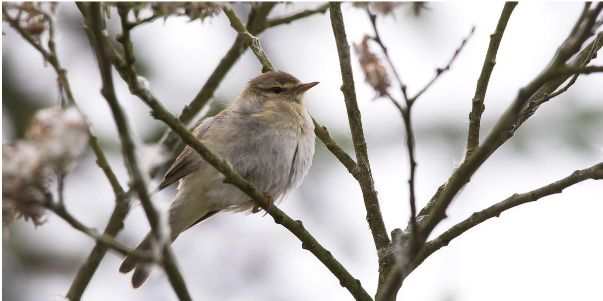
Fitis, Pælebjerg, 01.06.2019

In geringer Zahl täglich beobachtet. Schwerpunkte am Sønderho Strandsø , bei Nordby und am Pælebjerg .