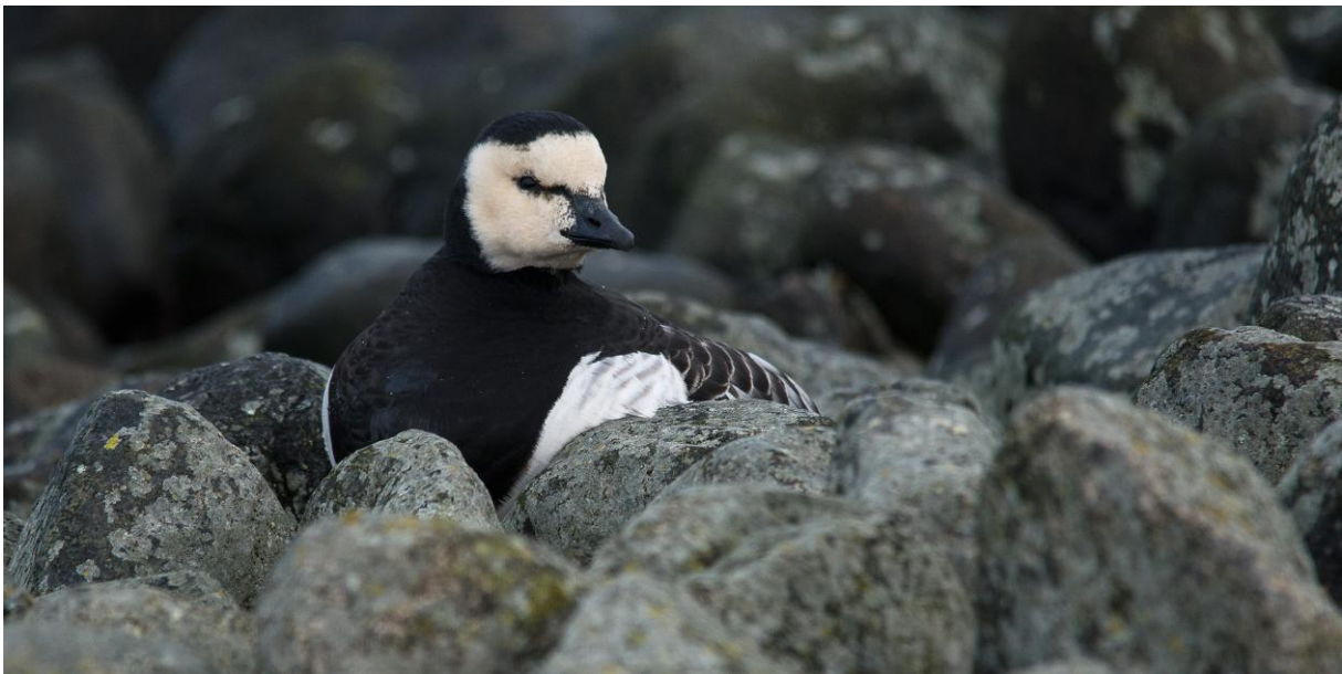
An Heiligabend ruht eine Weißwangengans zwischen Steinen auf der Promenade.

Häufig in lockeren Trupps auf dem Gemeindeheller und in den Salzwiesen. Am 24.12. ein einzelner Vogel zwischen Steinen auf der Promenade. Maximal rund 145 Ind. am 25.12. auf dem Heller.