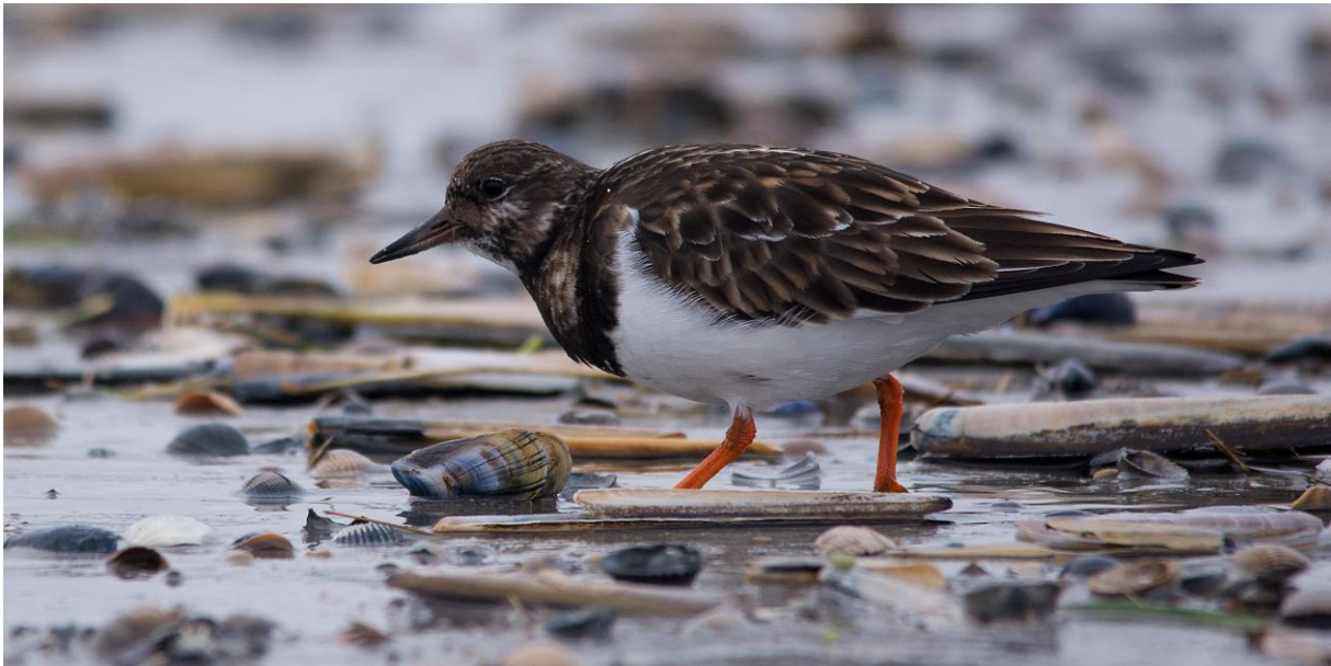
Steinwalzer in typischem Habitat zwischen zwei Buhnen auf Nahrungssuche (28.12.).

Am Westkopf und auf den Buhnen zuverlassig anzutreffen. Maximal um die 40 Ind. am 28.12., vom Sudwest-Strand uber die Buhnen bis zum Beginn des Nordstrandes verteilt.