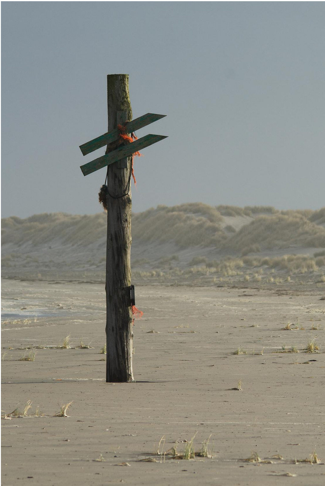
Massiver Wegweiser am Nordstrand