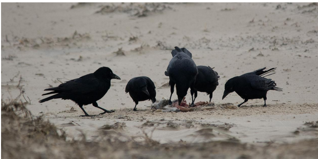
Rabenkrähen am Kadaver eines angespülten Wildkaninchens (Nordstrand, 28.12.).

Rabenkrähe Corvus corone Carrion Crow Omnipräsent. In allen Bereichen der Insel zu finden: an Strand und Westkopf, auf der Promenade, in den Salzwiesen und Dünen des Ostlands ebenso wie in West- und Ostdorf.