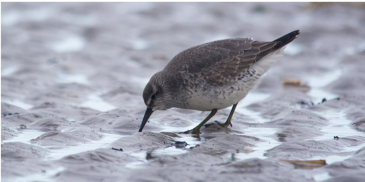
Knutt sucht im Watt nach Nahrung; Ostende am 27.12.

Knutt Calidris canutus Red Knot Am 27.12. suchen 8 Ind. im SK am dünnnahen Strand (Ostende) nach Nahrung und zeigen wenig Scheu.