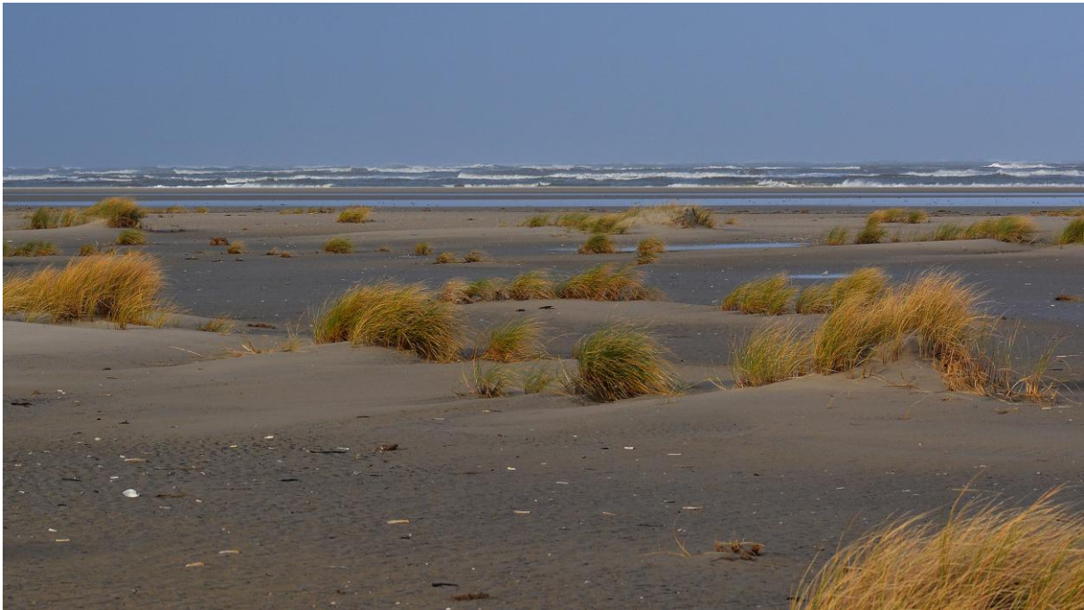
Nordoststrand bei ablaufendem Wasser.

Leider waren aufgrund der meist ungünstigen Hochwasserzeiten kaum Beobachtungen in den Salzwiesen möglich, wo sich die meisten der überwinternden Vögel aufhalten. Trotzdem ließen sich während des Aufenthalts 48 Vogelarten feststellen.