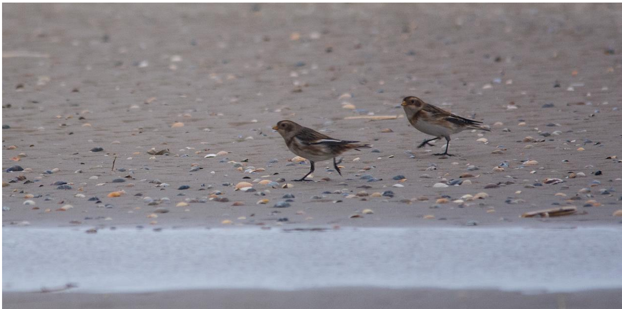
Schneeammern am Nordost-Strand, 25.12.

Drei Beobachtungen, alle im Osten der Insel: am 25.12. 3 Ind. kurz am Nordost-Strand; größter Trupp mit 29 Ind. am 27.12. (ca. 12.00 Uhr) ebenfalls am Nordost-Strand; am 29.12. fliegen etwa 20 Ind. über das Watt am Ostende in Richtung Salzwiesen nach Westen.