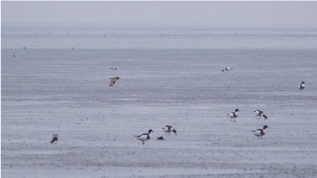
Sumpfohreule überfliegt das Watt, rundherum Brandgänse (am 23.12. in Nessmersiel).

Am 23.12. vor der Überfahrt nach Baltrum zwischen 14.00 und 15.00 Uhr im Hafenbereich von Nessmersiel u.a. wenige Grau- und Weißwangengänse, 100-200 Brandgänse, einige Stockenten, 5-10 Schellenten, 1 Zwergtaucher, 1 wf. Kornweihe, 1-2 Mäusebussarde, 1 Turmfalke, mehrere Blässhühner, wenige Austernfischer, zahlreiche Rotschenkel, etwa 200 Säbelschnäbler (im Speicherbecken), Sturm- und Silbermöwen, 1 Sumpfohreule flach über das Watt fliegend und 10-20 Strandpieper.