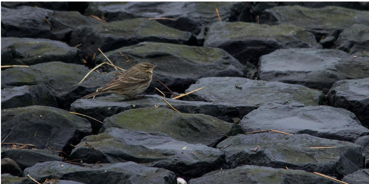
Strandpieper auf Bühne am Westkopf (28.12.).

Strandpieper Anthus petrosus Eurasian Rock Pipit Immer wieder Beobachtungen einzelner Vögel an der Promenade, auf den Bühnen am Westkopf und in den Dünengebieten des Ostlands.