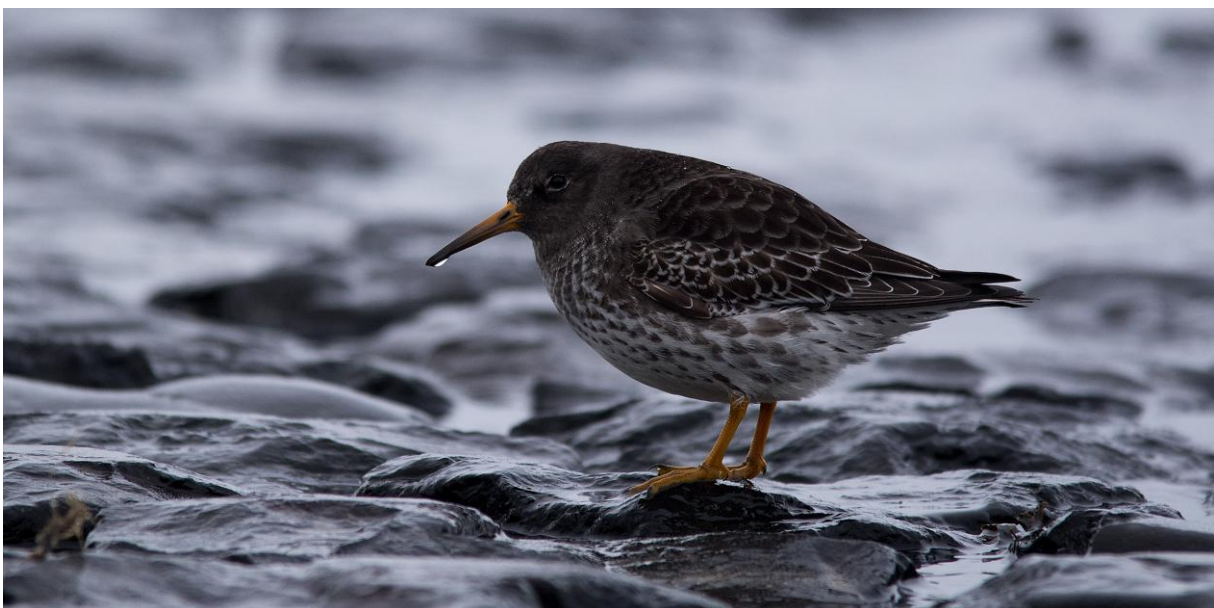
Ad. Meerstrandläufer auf Bühne am Westkopf (24.12.).

Verteilt auf den Bühnen des Westkopfs am 24., 28. und 29.12. bis zu 35 Ind. im SK. Am 26.12. bei Sturm zunächst mind. 23 Ind. auf der Hafenmole (10.45 Uhr), nachmittags um 15.30 Uhr suchen dann 17 Ind. mitten auf (!) der Promenade zwischen Pflastersteinen nach Nahrung und bei stärker auftretenden Böen Schutz hinter der spärlichen Vegetation am Wegesrand.