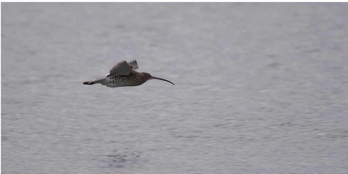
Groer Brachvogel vor Sudwest-Strand (28.12.).

Viele Einzelbeobachtungen in den Salzwiesen, auf dem Heller und dem Flugplatzgelande sowie bei Niedrigwasser in den Wattbereichen. Maximum mit einem Trupp aus (grob geschatzt) 80-100 auffliegenden Ind. am 27.12. im Bereich des Gemeindehellers.