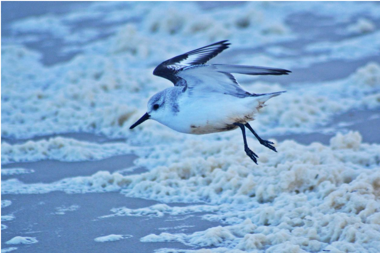
27.12.: Sanderling am Nordstrand.

Fast täglich beobachtet, meist in kleinen und losen Trupps entlang des Nordstrands. Dort bis zu 25 Ind. am 29.12. Am Südwest-Strand am 24.12. 3 Ind.